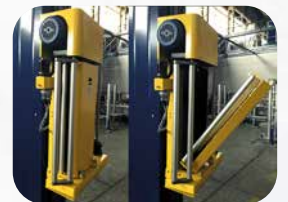
200% POWER PRE-STRETCH * (* on request)