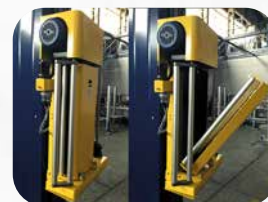
PRESTIRO MOTORIZZATO AL 200% * (* su richiesta)