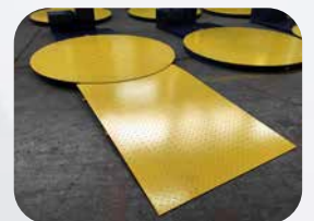
LOADING RAMP * (* on request)