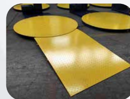
RAMPA DI CARICO * (* su richiesta)